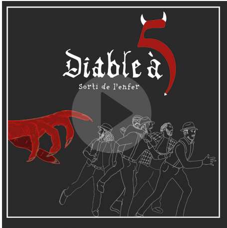
Sorti de l'enfer (2017)